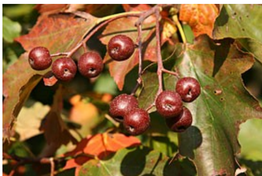
Abb. 2 - Früchte der Elsbeere im Herbst.