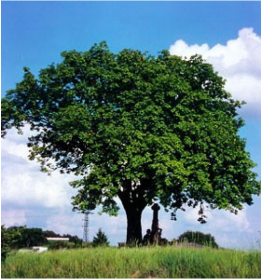
Abb. 3 - Grosse, freistehende Elsbeere bei Ripsdorf (D)

Die Elsbeere ist eine seltene Laubbaumart und vielen Menschen unbekannt. 2011 wurde sie zum Baum des Jahres erkoren. Grund genug, die "schöne Else", wie sie auch genannt wird, näher vorzustellen.