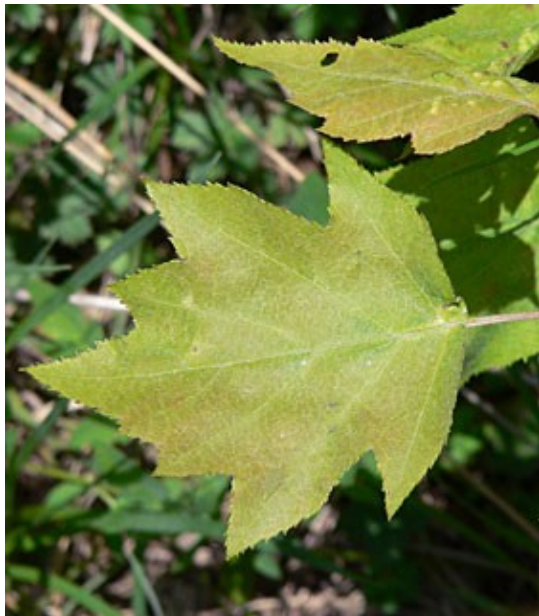
Abb. 1 - Die typischen Elsbeerblätter sind am Rand scharf gesägt.