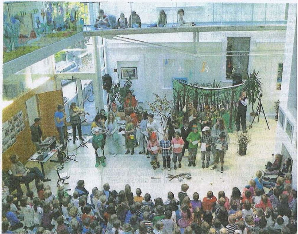
Die Theatergruppe Märchen T.E.E. bei ihrem Auftritt im österreichischen Michelbach.