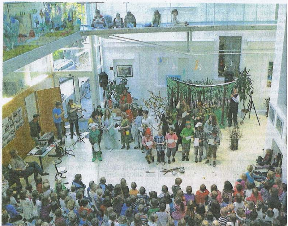
Die Theatergruppe Märchen T.E.E. bei ihrem Auftritt im österreichischen Michelbach.