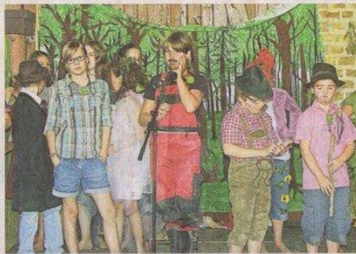
Die Kindertheatergruppe „MärchenT.E.E.“ führt das Stück „Die schöne Else“ auf.

Die Kinder schrieben sich das Stück selbst. Ein halbes Jahr brauchten sie für die Proben und bis das Stück und der Text saß. Jetzt war im Rahmen der Vita Romana im Europäischen Kulturpark Bliesbrück-Reinheim Premiere, die erste für „Märchen-