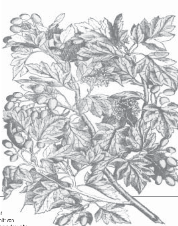
Darstellung der Elsbeere auf einem Holzschnitt von MATTHIOLOUS aus dem Jahr 1565 (aus von Schmeling, 1994)

Quellen: Düll 1959, Ebert 1999, Holz-Zentralblatt 2000, von Schmeling 1994.